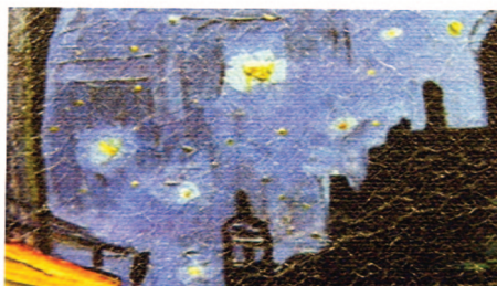
Zvětšený pohled na texturu povrchu

P/N TCMT-1 Matný vzhled P/N TCSG-1 Pololesklý vzhled